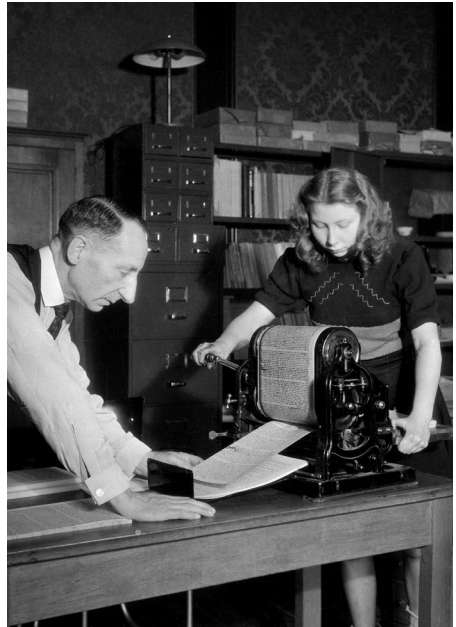
Illegale drukkerij, in museum Willet Holthuyzen(1945).

Ook dit jaar roepen we alle bewoners van joodse huizen in heel Nederland op de herdenkingsposter voor het raam te hangen. Woont u in een huis waarvan de joodse bewoners zijn gedeporteerd? Herdenk mee en print de herdenkingsposter via www.communityjoodsmonument.nl/poster