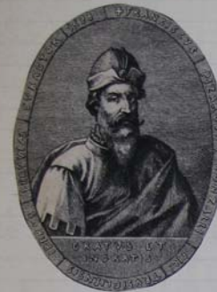
Don Francisco Pizarro (1475-1511), naar een oude gravure.

Den 26en Juni zal het vierhonderd jaar geleden zijn, dat een der beroemdste Spaansche veroveraars in de hoofdstad van Peru, het zes jaar te voren door hem gestichte Lima, het leven liet. De vrienden van den door hem ter dood gebrachten vroegeren wapenmaker Diego