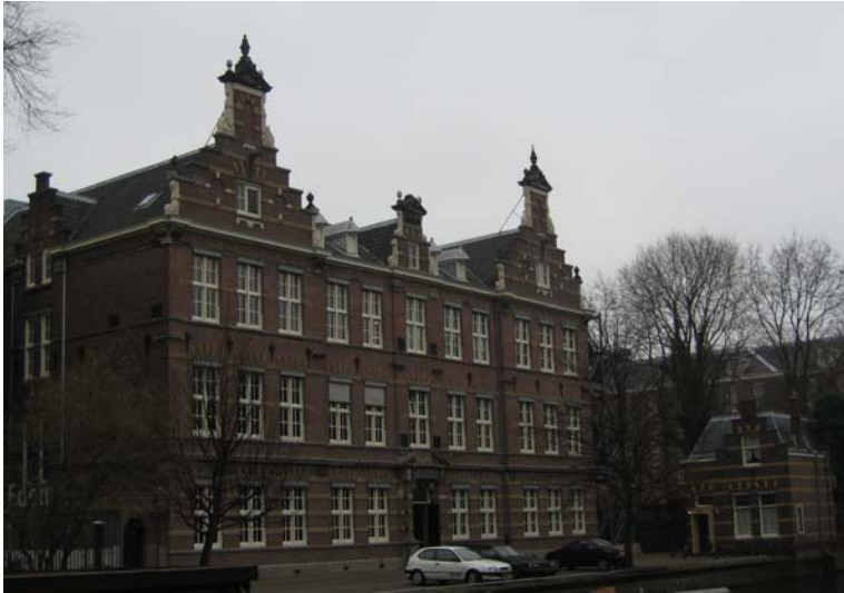
De Kweekschool voor Onderwijzers en Onderwijzeressen te Amsterdam, gezien vanaf de Nieuwe Prinsengracht. De andere zijde grenst aan de Nieuwe Kerkstraat.