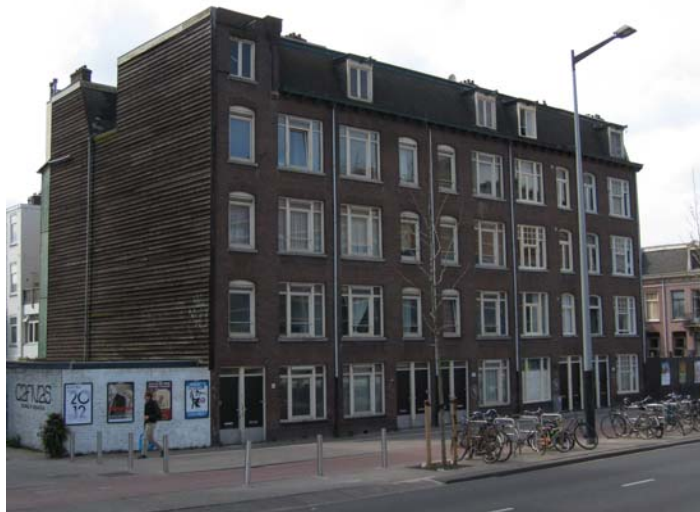
Op deze foto uit 2012 is het meest linkse huis dat van Sara, zij woonde op Spoorbaanstraat 7huis d.w.z. de begane grond. Ten tijde van deze foto waren de huisnummers 1, 2 (rechts) en 8 (links) al afgebroken.