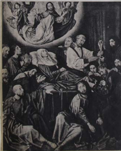
Op een dier werd door St. Oude-mans te de schen, wat met en uitge- te yverder of kwam. kenelische en land schaffend te, omde vigeude, 181-201.

deren van het altaarstuk. Olie, als hi de verf toevoegd, gaf ze glans en die het fresco, noch het tempera kennde, d zatte, volle, zware kleuren, waarin de het noorden van het leven onder onze nen gaan verhalen. Maar het langaam olieverf was van veel grootere beto hetgen het zinnelijk intellect te zeg, deden de bestaande technieken, die o voortvarende uitvoering vroegen, vol het noordelijk materialisme moest door schilders, analyseerend als zij waren, ni op te bouwen methode uit de verf ge