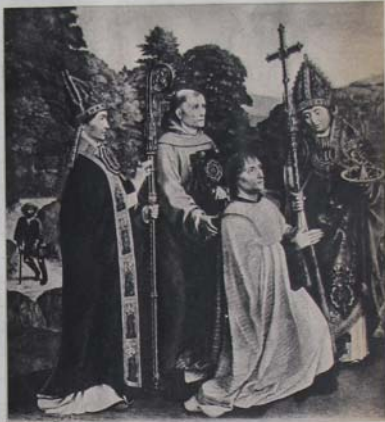
PETRUS CHRISTUS: ST. ELIGIUS. — Petrus Christus, in de buurt van 's Hertogenbosch geboren, streefde hoër na dan van Eyck te Brugge, geeft in dezen St. Eligius, patroon der goudsmidde, een blik in het dagelijksch leven van den juwelier. Als uitdrukking van het vijftiende-eeuwse Nederlandsche realisme is de schilderij karakteristiek en uniek.

Met één slag is Vlaanderen voor de schilderkunst even belangrijk als Italië, en niet het minst door de vinding, die de Van Eycken deden onder het schil-