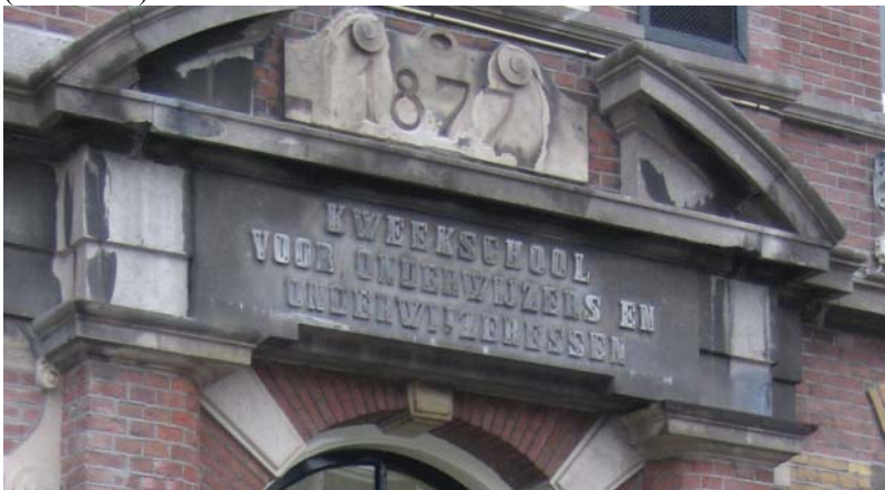
De ingang aan de Nieuwe Prinsengracht.