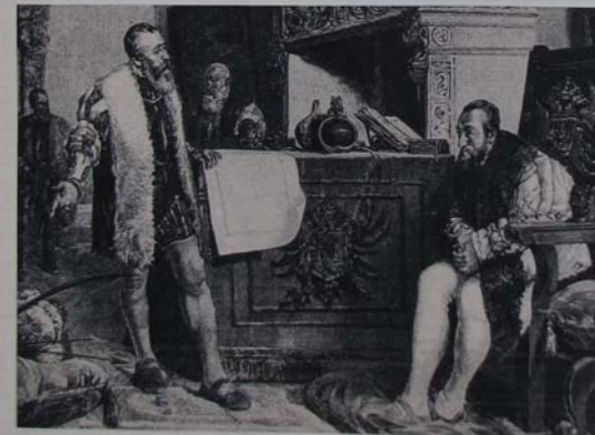
Het onderhoud tusschen Karel V en Pizarro, Martin de laude de bestemming veroverer naar Peru uit te redden en deze als algemeen overzetter te leiden.

richten over de onmetelijke rijkdommen van het zuidelijke goudland, het rijk der Inca's, hadden bij hem het verlangen doen rijpen, zelf een expeditie te ondernemen, om het te veroveren. Met twee andere Spaansche avonturiers, den lieftuiven reeds gemen den Diego de Almagro en Hernando de Luque sloot hij een partnerschap contract, om voor gezamenlijke rekening het goudland te ontdekken.