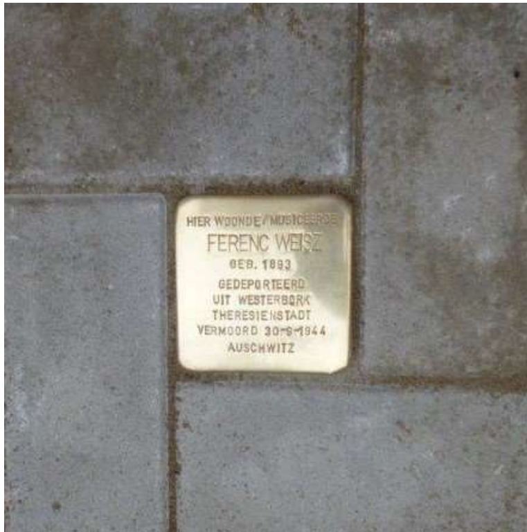
Stolperstein geplaatst op 2 maart 2013 bij de Deurloostraat 74hs in Amsterdam