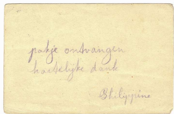
Briefkaarten uit 1943 aan dochter Debora vanuit Kamp Westerbork