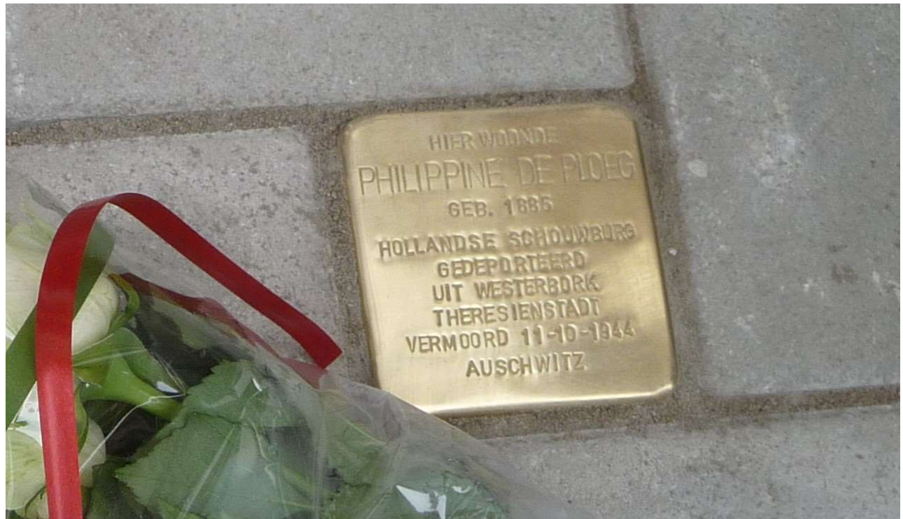
Stolperstein op 2 maart 2013 geplaatst bij de Lekstraat 50 II in Amsterdam