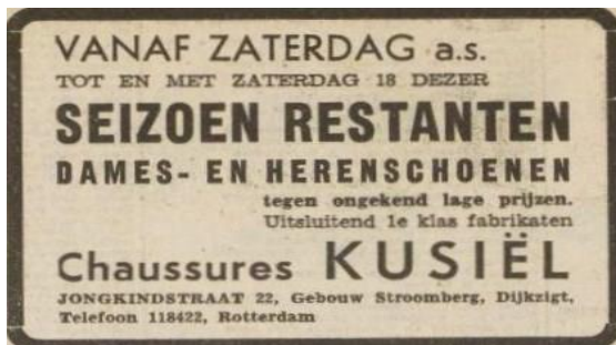
Advertentie Het Vrije Volk, 9 juli 1953

Centrum weer een schoenenzaak begonnen met de modieuze Franse naam 'Chaussures Kusiël'.