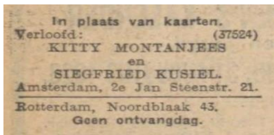
Verlovingsadvertentie Algemeen Handelsblad 31-8-1928